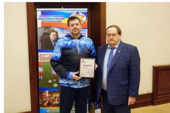
Победители регионального этапа конкурса «Россия – футбольная страна!» в номинации «Лучший проект в области развития массового футбола среди лиц с ОВЗ»: "Комета" - клуб адаптивного футбола для особенных детей»