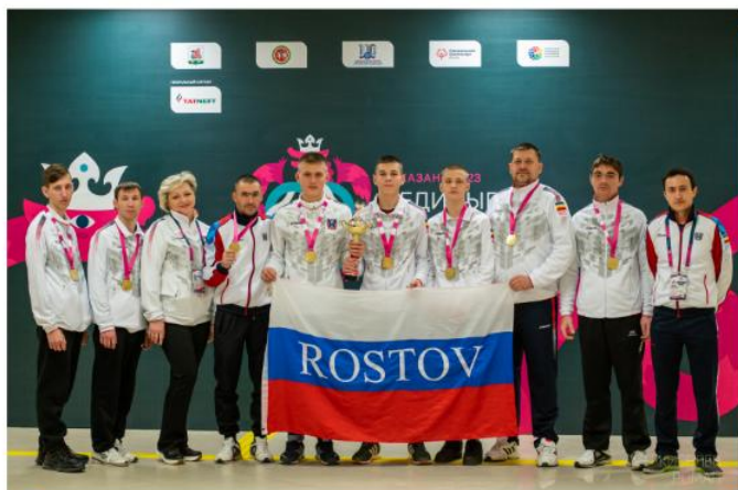
1 место в соревнованиях по мини-футболу на «Единых играх Специальной Олимпиады для спортсменов с особенностями развития» в г. Казани