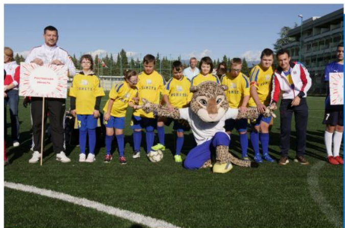
3 место во Всероссийской Спартакиаде Специальной Олимпиады по мини-футболу «Матч Добра» в г. Сочи