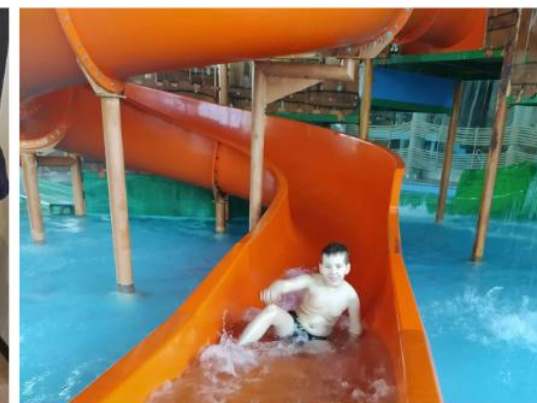
Походы в аквапарк