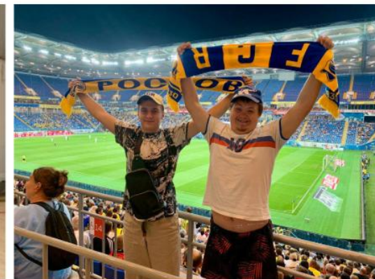
Посещение игр ФК "Ростов" и экскурсии на Ростова-Арену