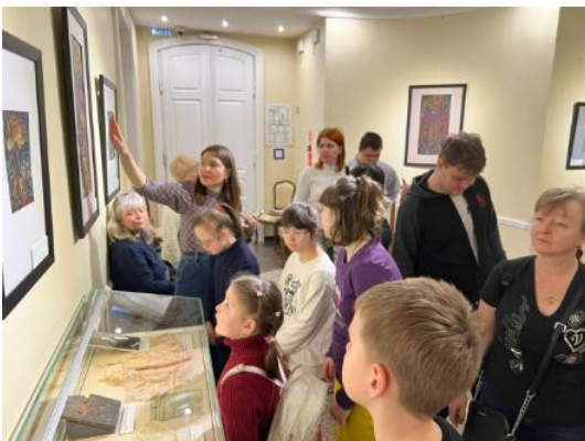
Посещение музея "Шолохов-центр"