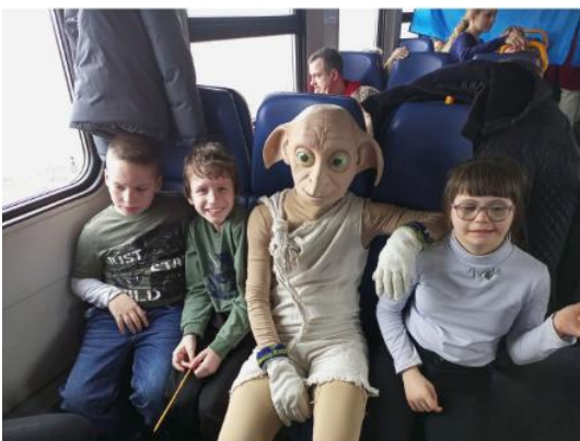
Участие в квестах

Благодаря партнерам, мы организуем разнообразный досуг наших спортсменов