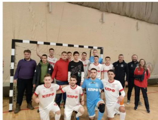
Посещение матчей МФК "Ростов" и ГК "Ростов-Дон"