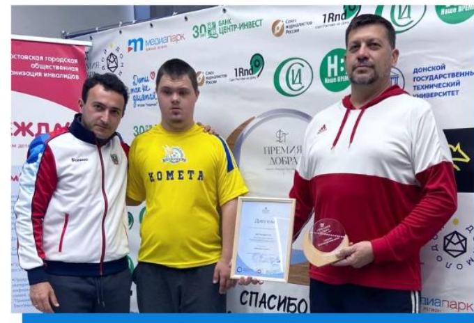
Лауреаты «Премии добра» 2023 за проект по адаптивному футболу в номинации «Движение — жизнь!»