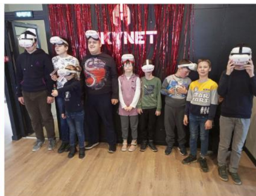
Игры в клубе виртуальной реальности